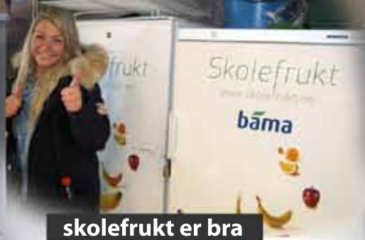
skolefrukt er bra