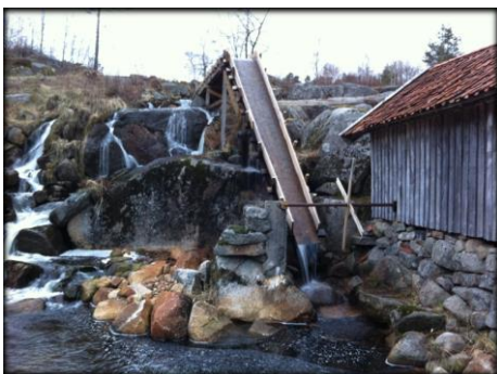
Restaurert vannsag, Aurebekk.