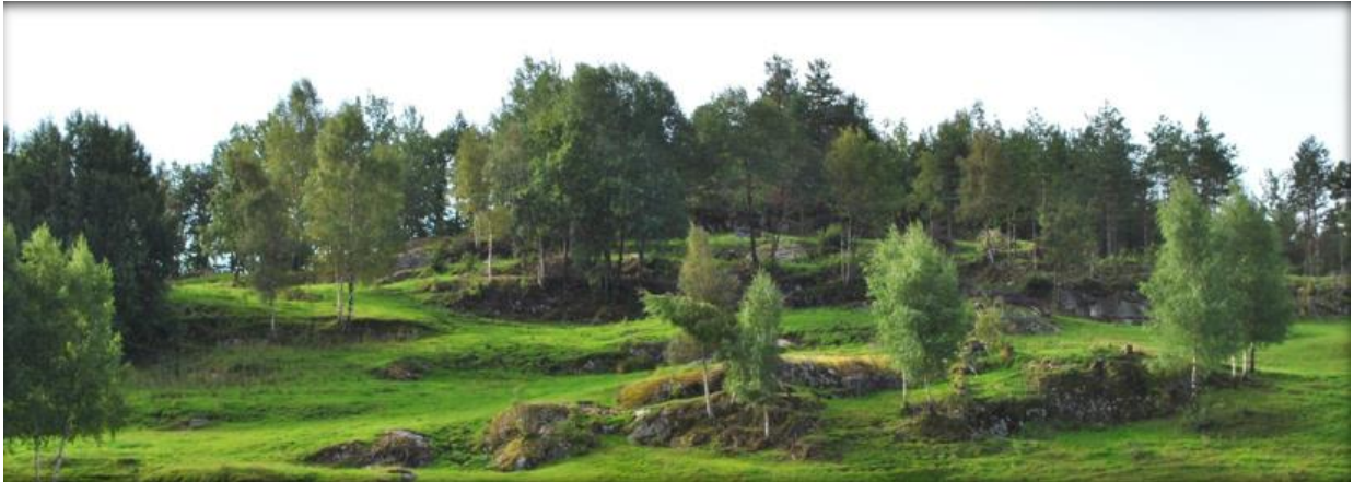
Restaurert beite, Heddeland.

SMIL-midlene skal bidra til å redusere miljøbelastninger og fremme miljøgoder i jordbruket. Formålet er å fremme natur- og kulturminneverdier og å redusere forurensningen fra jordbruket, utover det som kan forventes gjennom vanlig jordbruksdrift.