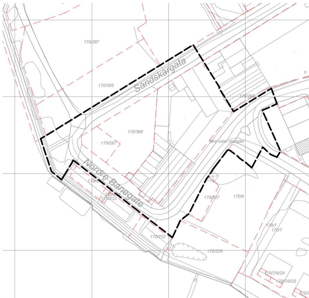
Figur 1 Varslet planavgrensning er markert med svart stiplet linje.

Arkitektværelset og AFRY Ark Studio, på vegne av forslagstiller Vaieren eiendom AS, varsler herved om igangsetting av arbeid med detaljreguleringsplan for etablering av nybygg for kontor, tjenesteyting og bolig, samt park og parkeringskjeller, gbnr.: 170/267, 170/369, 170/263 og 170/334 i henhold til plan- og bygningslovens §§ 12-1, 12-3, og 12-8.